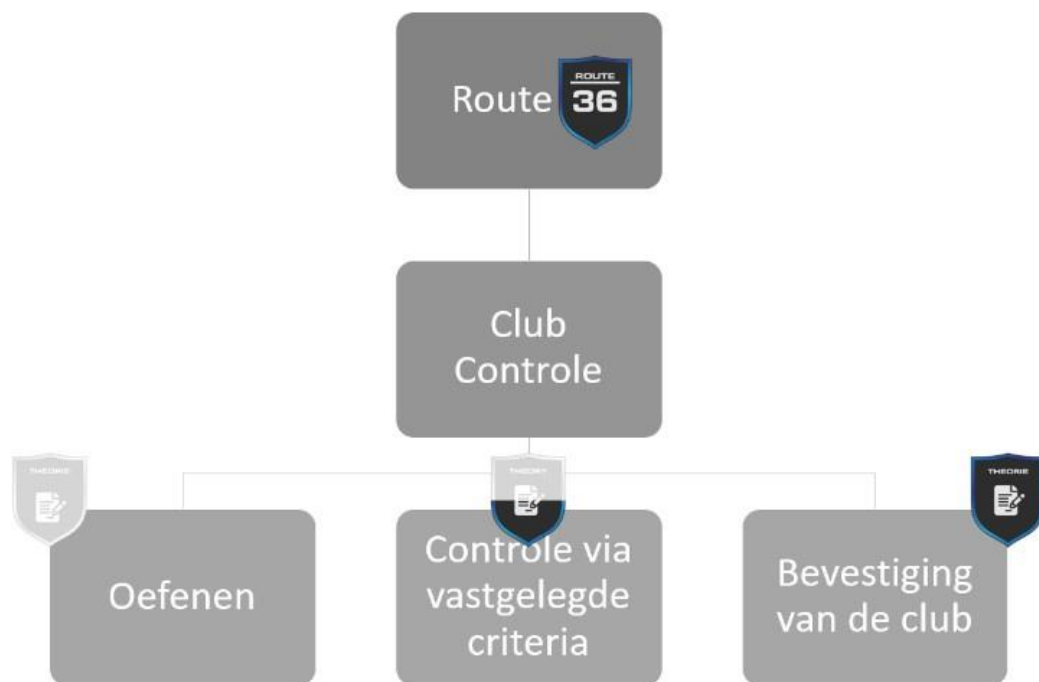
Figuur 2: Club Controle R36

Als club willen we meewerken aan het traject van de beginnende golfer. De speler krijgt de mogelijkheid om een aantal zaken zelfstandig te oefenen ('self-assessment'). Indien de speler voldoet aan bepaalde criteria, zal hij een half gekleurde badge verdienen. De club zal daarna deze score valideren ('club controle'). Pas wanneer de club de score goedkeurt, zal de badge volledig gekleurd en als behaald beschouwd worden.